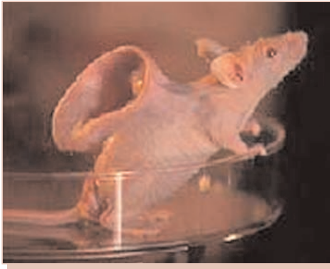
Figura 2. El ratón-oreja