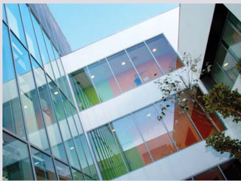
Edifici IN3 Parc Mediterrani de la Tecnologia Castelldefels

El creixement orgànic de la UOC és constant i sostingut. En aquest curs 2003-2004 el nombre de matriculats s'ha incrementat un 16%.