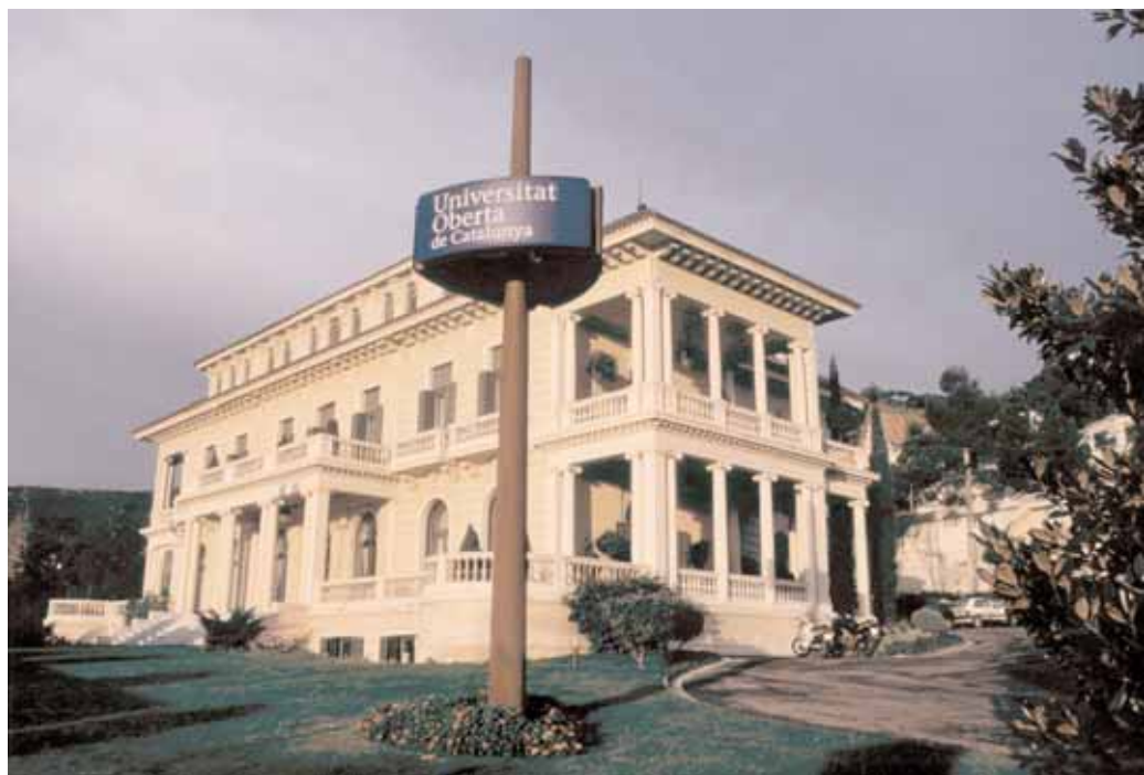
Edifici seu central