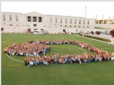
Logo format per l'equip professional de la UOC en commemoració dels deu anys de la seva creació

El curs 2004-2005 la UOC ha fet deu anys: ha estat una dècada d'innovació, eficàcia i qualitat docent durant la qual s'ha guanyat el respecte i el prestigi internacionals. També ha estat el curs de l'aprovació del marc general de recerca de la UOC, de la continuació de l'ambició estudi sobre la societat de la informació, el Projecte Internet Catalunya, i de la posada en marxa de l'@tenu universitari (la possibilitat de posar a l'abast de més persones l'accés a la Universitat). Les enquestes d'avaluació sobre el nivell de satisfacció dels estudiants mantenen uns valors de 4 punts sobre 5. Pel que fa als graduats, el 88% dels enquestats afirma que ha millorat el seu criteri i capacitat crítica, i el 82% declara que ha millorat professionalment.